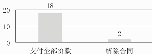
图2 适用《合同法》第167条的分期付款股权转让纠纷案件

分期付款买卖合同的规定,涉及案件共20件。该20件案件中,有18件案件当事人依照第167条的规定请求支付全部价款,仅有2件案件当事人请求解除合同(图2),法院对其中的一件予以支持解除合同, [35] 另一件予以驳回。 [36] 虽然这一样本未必能全面反映实际,但该样本提供的数据表明当事人请求解除合同的情形在司法实践中可能并不多见。如果这一样本反映了真实情况,这就意味着指导案例67号裁判规则对同类案件参照适用的示范意义并没有想像得那么大,但该裁判规则会严重影响今后该类案件的当事人对有关诉讼请求的提出。该20件案件充分说明审判实践中存在着分期付款股权转让合同参照适用第167条的事实。这一事实难以印证指导案例67号裁判理由中主张的股权转让合同不同于以消费为目的的一般买卖合同的观点,相反,该司法审判经验削弱了该指导案例裁判理由的说服力和透彻性。